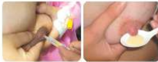
نحوه جمع آوری آغوز

تغذیه نوزادان کم وزن در هنگام تولد و شیرخواران بیمار: برای شیرخواران برحسب نیاز آنان به تغذیه که معمولاً هر ۳ ساعت یکبار یا ۸ بار در ۲۴ ساعت است شیر باید دوشیده شود. نوزادان نارس و کم وزن در ابتدا نیاز به شیر کمتری دارند باید ضمن تشویق مادر به دادن آغوز از همان مقدار کم، و با استفاده از روش‌هایی از قبیل جمع آوری مستقیم شیر با سرنگ از نوک پستان، دوشیدن در قاشق و یا فنجان کوچک، یا دوشیدن مستقیم در دهان، تغذیه شیرخوار انجام شود و هر ۲-۳ ساعت یکبار آغوز را بدوشند.